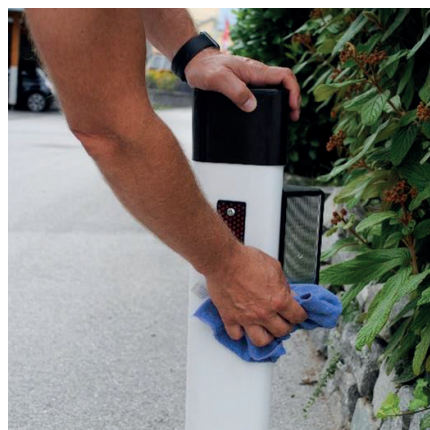
Entretien et nettoyage semestriel recommandé